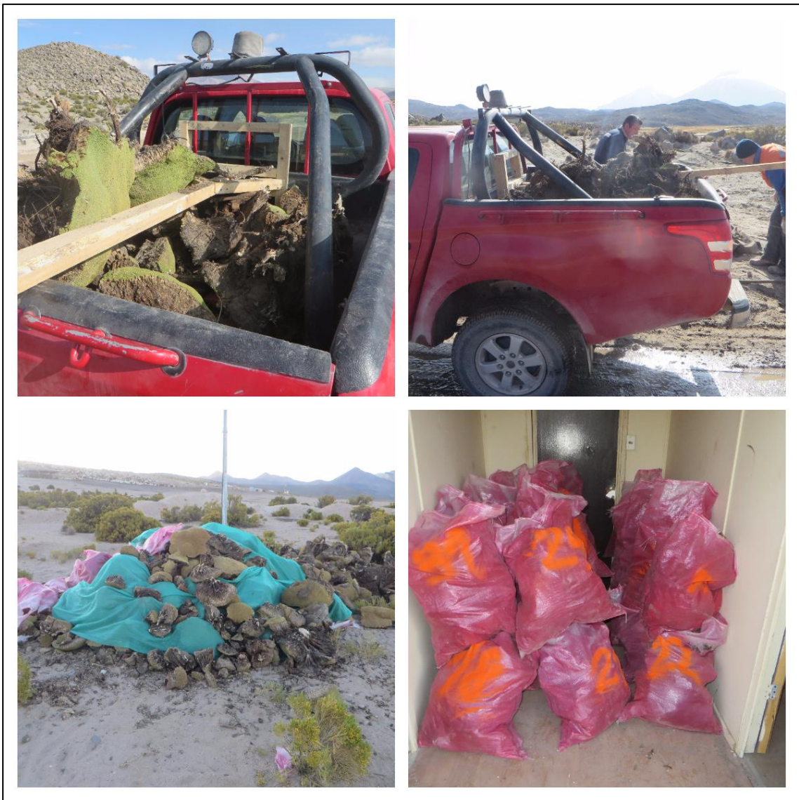
Imagen 3. Proceso de acopio de llaretas en campamento de faena.

En el mes de diciembre se terminaron de extraer la totalidad de las llaretas del by pass, consideradas en el plan de xerófitas y dispuestas para entrega. En enero del 2018 se terminó el proceso de ensacado.