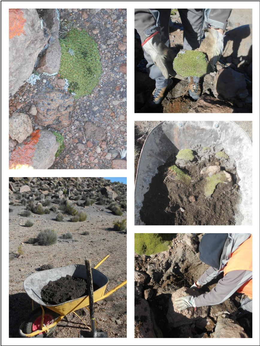
Imagen 1. Registro de acción de traslado y trasplante de llaretas.

Del total a extraer, 200 individuos se destinaron a trasplantes, como se aprecia en la imagen siguiente: